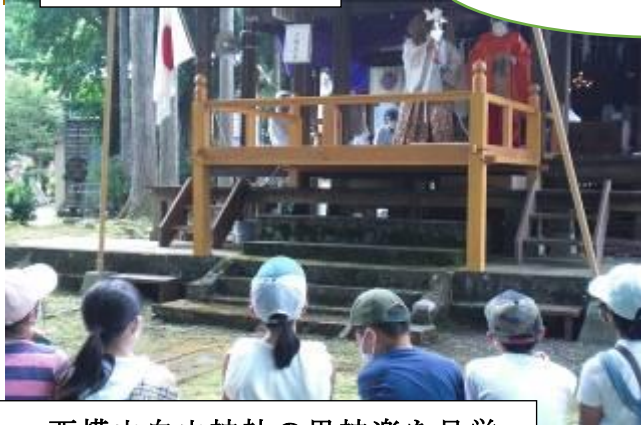
西横山白山神社の里神楽を見学