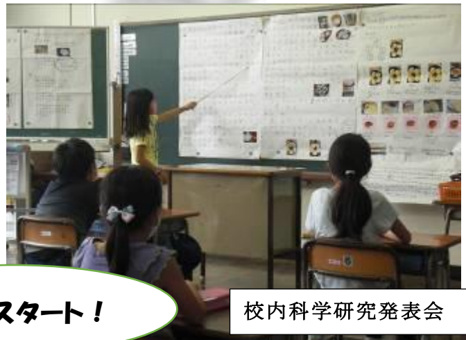
校内科学研究発表会