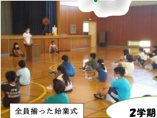
全員揃った始業式