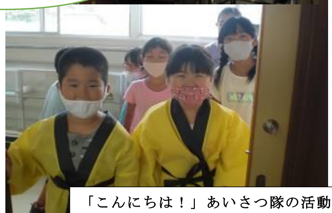
「こんにちは！」あいさつ隊の活動