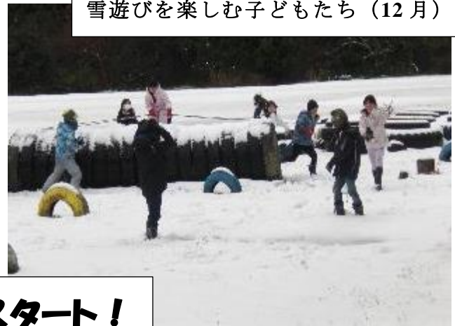
雪遊びを楽しむ子どもたち (12月)