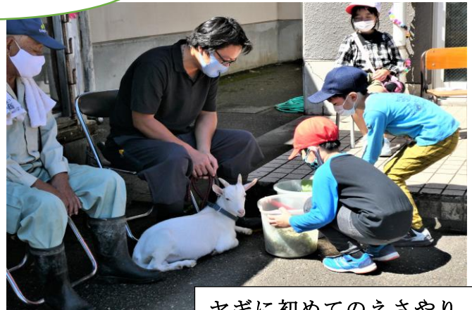
ヤギに初めてのえさやり