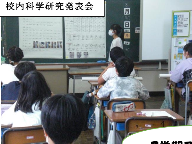
校内科学研究発表会