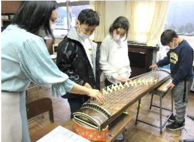
1/18(水) 箏、尺八の体験(3,4年生)