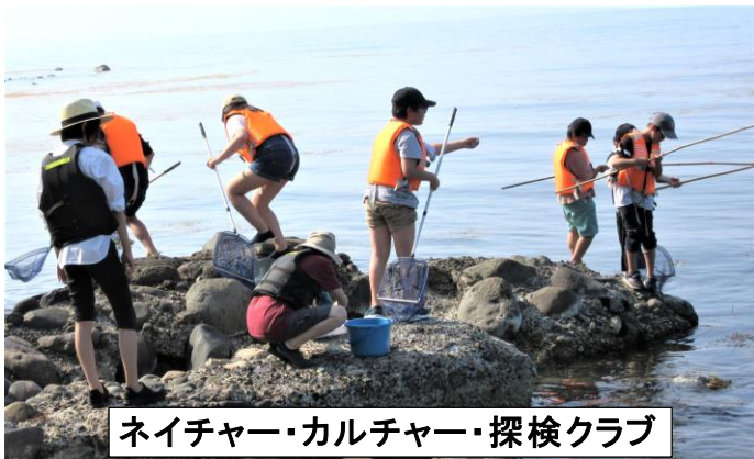
ネイチャー・カルチャー・探検クラブ