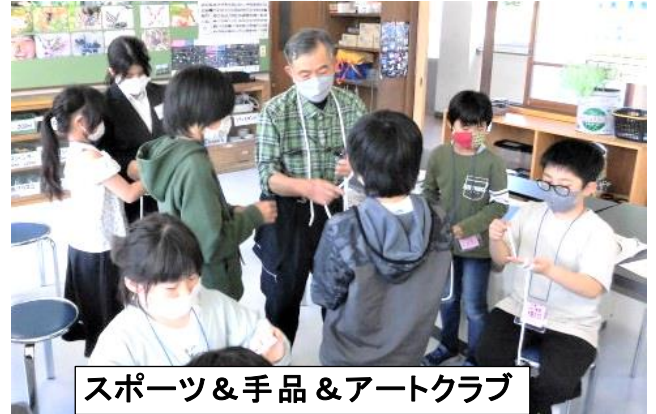
スポーツ&手品&アートクラブ