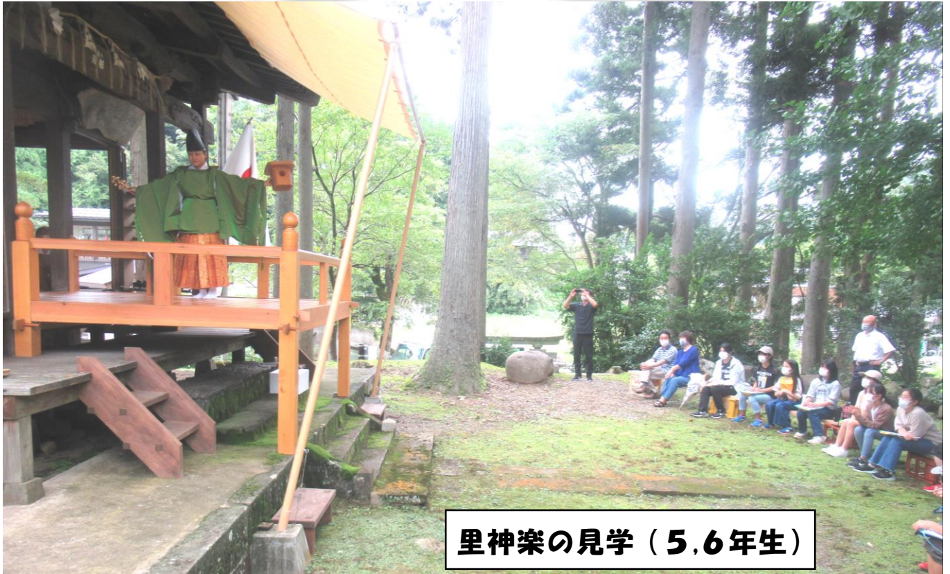
里神楽の見学（5,6年生）